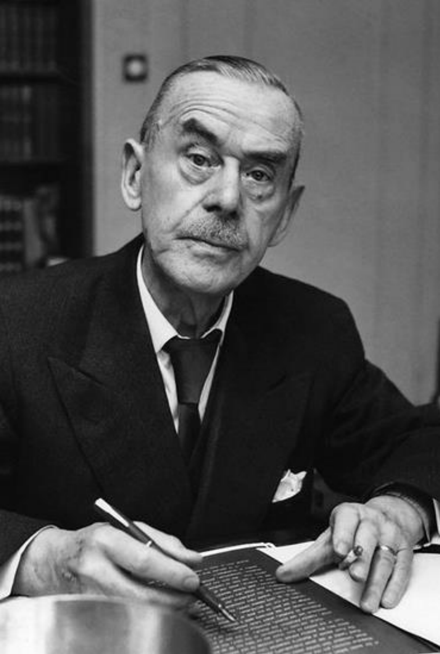
Thomas Mann (1875-1945)

„Mélységes mély a múltnak kútja. Ne mondjuk inkább feneketlennek? Feneketlennek még akkor is és talán éppen akkor, ha kizárólag és egyedül az ember az, akinek múltjáról kérdés és szó esik: ez a rejtélyes lény, aki a magunk természeti-gyönyörúséges és természetfeletti-nyomorúságos létének tartálya, s akinek titka érthető módon minden kérdésünk és szavunk alfája és ómegája, s minden szavunkat hévvel és szorongással és minden kérdésünket izgatott sürgetéssel telíti. Mert éppen ekkor történik az, hogy minél mélyebben fürkésznünk, minél messzebbre hatolunk és tapogatózunk a múlt alvilágába, az emberinek, történetének, művelődésének kezdeti alapjai tökéletesen megmérhetetlennek bizonyulnak, s mérőónunk előtt, bármily kalandos távolságokba gombolyítjuk alá zsinagét, mindig újra és tovább húzódnak vissza a feneketlenségbe. Találón mondhatjuk itt, hogy "újra és tovább", mert kutató buzgalmunkkal a kikutathatatlan incselkedő játékot űz: látszatmegállókat és úti célokat kínál, melyek mögött, amint elértük őket, újabb múltszakaszok tárulnak föl, ahogy a partjáró bolygása sem ér soha véget, mert minden egyes megmászott agyagos fövenykulissza mögött új távolságok csábítanak új hegyfokok felé.