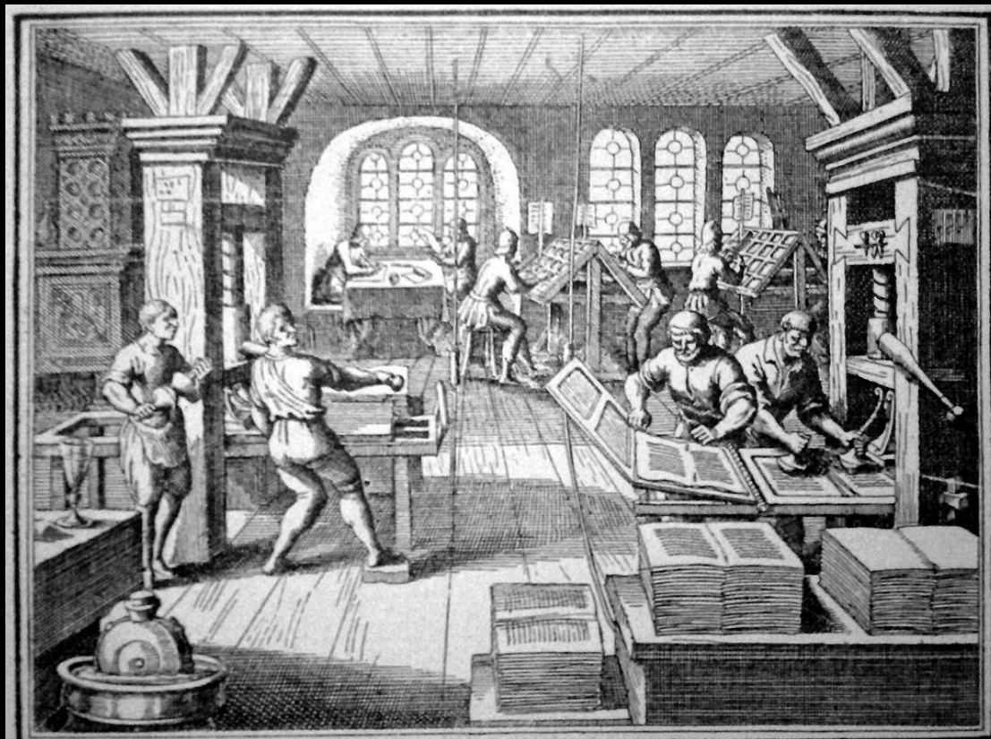
Egy nyomda belseje a XVI. század elején. A kor nagy szellemi mozgalmait legjobban terjedtek a könyvnyomtatás által, amely abban az időben már rendkívül kifejlesztett Németországban. Több mint ezer nyomda működött országszerte és amint e képen (amely Gottfried Történelmi krónikájából való) is látható, a nyomdák berendezése — bármilyen kezdetleges volt is a fel- szerelés különben — nagyon hasonlított máris a mai nyomdákhöz. Persze gőz és villanyerő helyett csak az emberi erő végezte még akkor a munkát. Háttul a szedőket és a korrektort, elől jobb felől pedig Amman Jost kézi sajtóját láthatjuk.

S i linguis hoim loqr ⁊ āgelorū: caritatē aut nō habeā: fact⁹ sum velut es sonās aut tīmbalū tīnniens. Et si habuero pphetiā ⁊ nouerī mīsteri- a oīa et omnē sciētīā ⁊ habuero omnē fidē ita ut mōres trāstterā: caritatē aut nō habuero: nichil sum. Et si distribu- ero ī cibos pauperū omnes facultates meas ⁊ si tradidero corp⁹ meū ita ut ardeā: caritatē aut nō habuero: nichil michi pdest. Caritas patiēs est: betū-