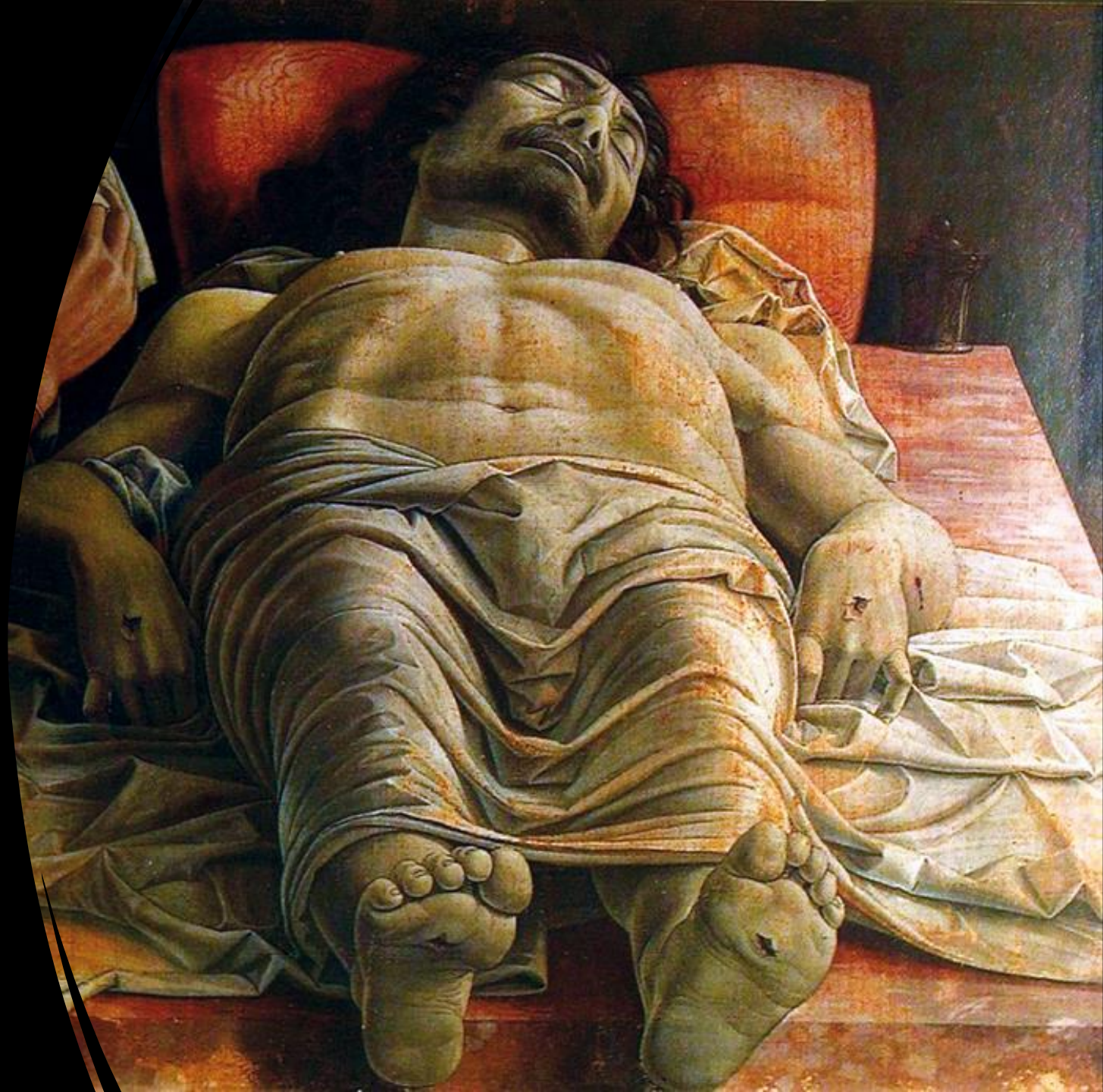
Mantegna: Halott Krisztus siratása (1480)